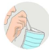
Pour le retirer, je ne touche que les attaches