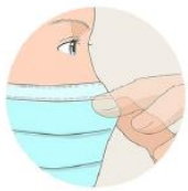
Je pince le bord rigide pour l'ajuster à mon nez