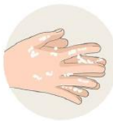
Je me lave les mains