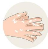
Je jette mon masque et je me lave les mains