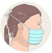
J'attache le bas de mon masque