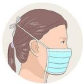
J'attache le haut de mon masque